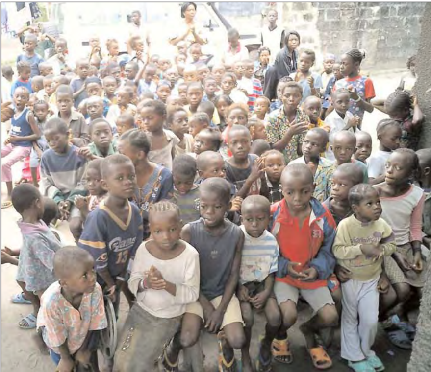
98 Waisenkinder sind noch übrig, laßt uns ihnen eine Zukunft geben!

tiefen wollen, wie so viele Menschen im Kongo, bieten wir einen wöchentlichen speziellen Bibel Studien Kurs an, die "12 Grundbausteine". Er behandelt Themen wie Ewige Errettung, das Wort Gottes, Liebe, Gebet, vom Himmel hören, die End-Zeit und Rückkehr Jesu usw. Falls jemand an einem dieser Themen interessiert ist, gebt uns bitte Bescheid, und wir versuchen unser Bestes, Euch entsprechendes Material zuzuschicken.