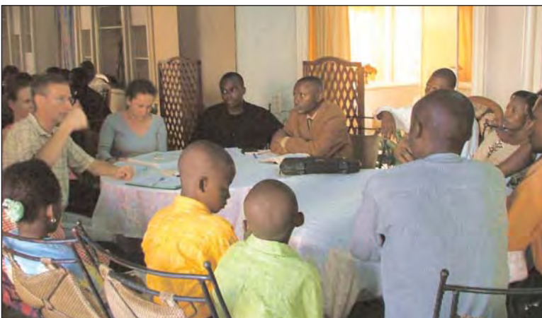
Eine unserer wöchentl. Bibel Studien - die "12 Grundbausteine"

Um dieses Ziel zu erreichen, verteilen wir Traktate mit dieser Botschaft über Gottes Liebe und die Nächstenliebe. Auch verbreiten wir die "Activated" Hefte sowie anderes hilfreiches, erzieherisch und geistig aufbauendes Material. Und für alle, die ihre persönliche Beziehung zu Gott ver-