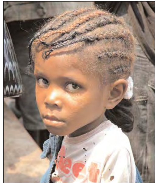
Braunes Haar, Unterernährungszeichen