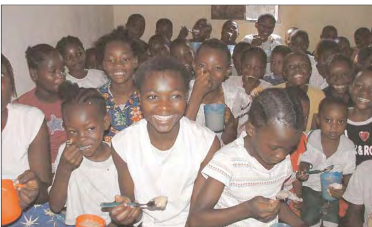
Zuerst brauchten sie etwas zum Essen für die Sofort-Hilfe. Die Landwirtschaft ist für ihre Zukunft - Hilfe zur Selbsthilfe!