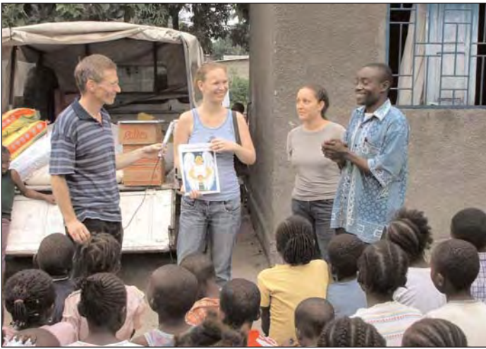
Präsentation von Lebensmitteln und Schulmaterial