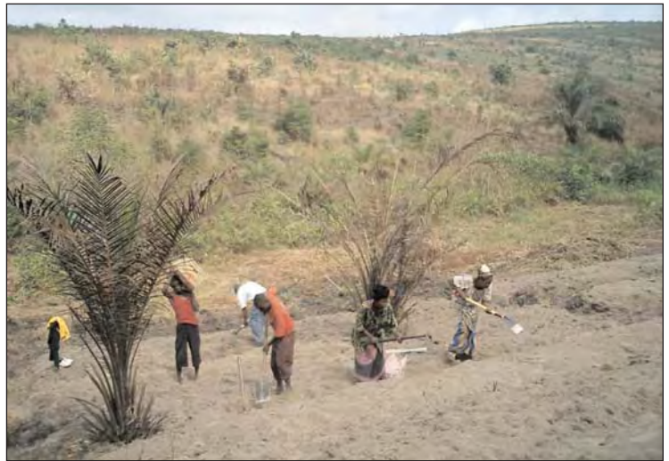
Roden des wilden Ackers, viel Arbeit mit Spaten und Hacke