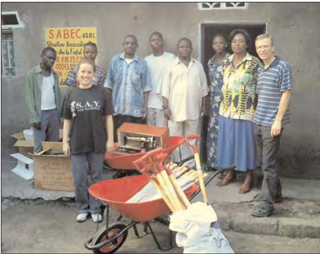
Zwei Nähmaschinen und Werkzeuge für den Ackerbau