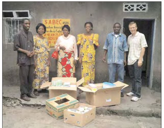
Samen fürs Feld und Medikamente für die Kinder