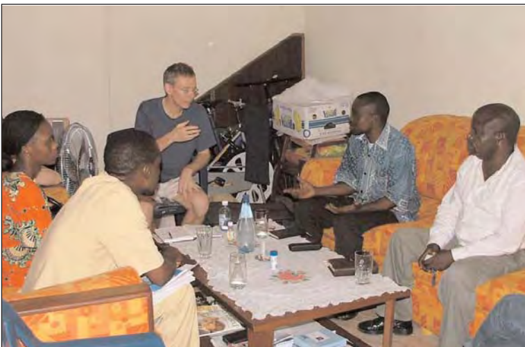
Wir planen mit SABEC Mitgliedern für die Zukunft der Waisen