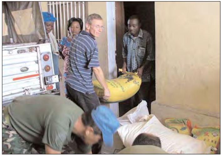
Abladen von 500 kg Reis, Mehl, Bohnen usw beim Lager

von einem Apotheker Freund dort. Auch kauften wir zwei Nähmaschinen, damit sie etwas Geld verdienen und die Kinder ausbilden können. Wir investierten aber hauptsächlich in ein Landwirtschafts-Projekt. Kinshasa ist mit gutem Boden umgeben, aber kaum jemand fängt etwas damit an. Dafür gibt es auch Gründe. Die Armen haben kein Geld, und selbst wenn jemand so ein Projekt starten will, sind die Feldwege extrem schwer zu passieren und es gibt so gut wie keine Infrastruktur.